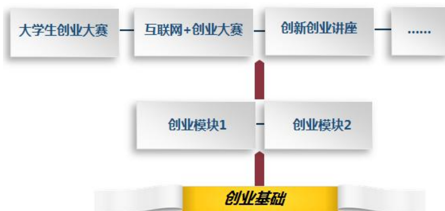
图3 创新创业课程体系建设思路

学生创新创业活动，促进创新创业的实践教学。其次，可以按照创业活动项目和特定的活动方式，开发创业沙盘、教学游戏和教学案例库，通过现实或模拟的创业实践活动，利用与专业相关的实践平台，利用虚拟的训练或虚拟创业公司，让学生身临其境地感触和体验创业的全部业务流程。创新创业实践课模块安排在第3-5学期，让学生在结合所学的专业基础上来领悟创新创业知识，提高创新创业能力。